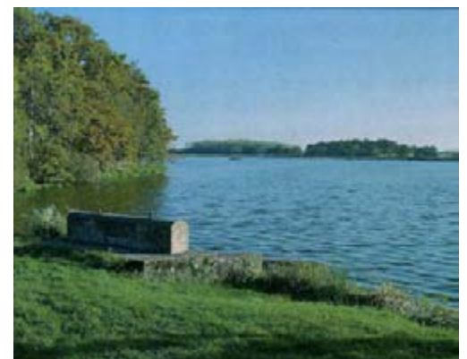
La Dombes, territoire des étangs