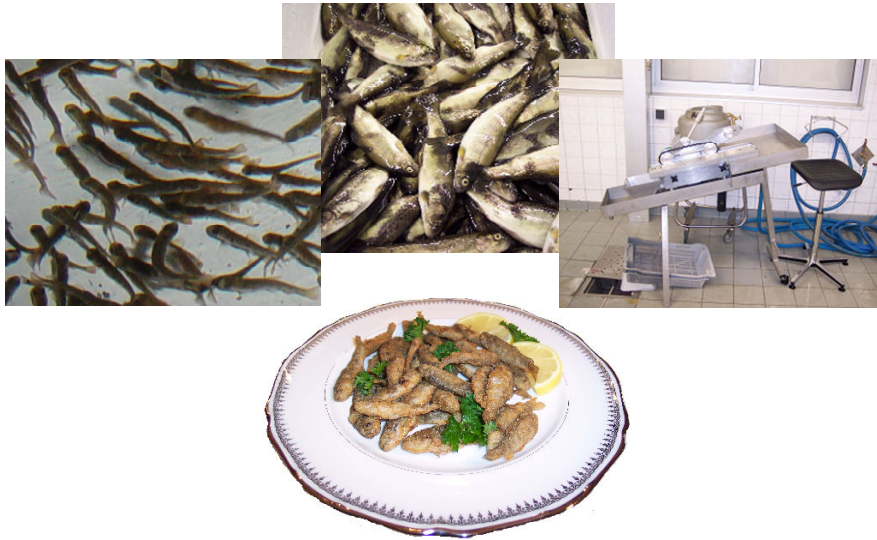
La Friture de truitelles : du bassin à l'assiette