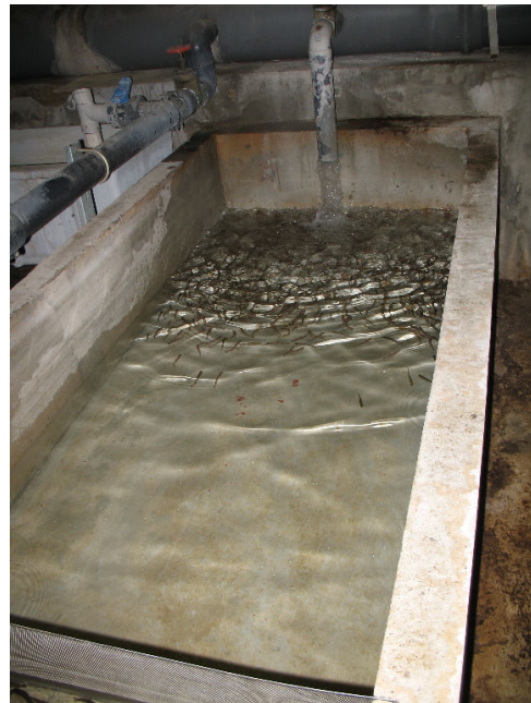
Bassin béton intérieur

Cette comparaison avait pour but de mettre en évidence l'efficacité de la mise à jeun en fonction des conditions de stockage (qualité d'eau, nature des structures, ...). L'absence ou la présence de particules solides dans la cavité abdominale et d'amertume ont été vérifiées lors de dégustations.