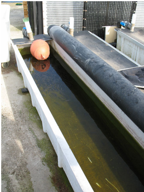
Auge PVC extérieur

Un lot a été mis à jeun dans un bassin béton du laboratoire d'alevinage de la Pisciculture Charles MURGAT SAS sur une eau de forage et le deuxième a été suivi en extérieur sur une eau de source réutilisée 3 dans des auges PVC bâchées. Le lot témoin était élevé dans le laboratoire.