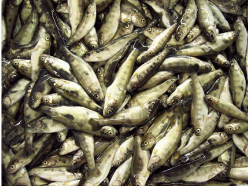
Truitelles de 3,5g