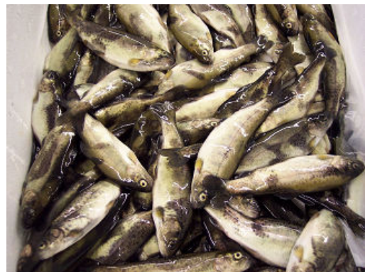
Truitelles de 10-12g