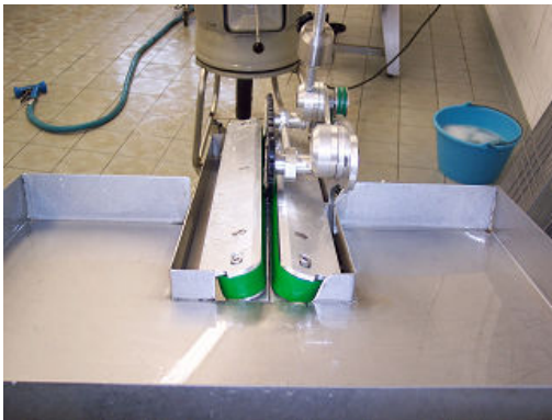
Poste de travail

Le principe de cette technique repose sur un convoyeur à bandes entraînant le poisson au contact d'un couteau circulaire rotatif et dentelé qui ouvre et éviscère les poissons dans le même temps. L'engagement des poissons est effectué par une personne à partir d'un plan de travail légèrement incliné. Après éviscération les poissons sont lavés afin d'éliminer les éclats de viscères.